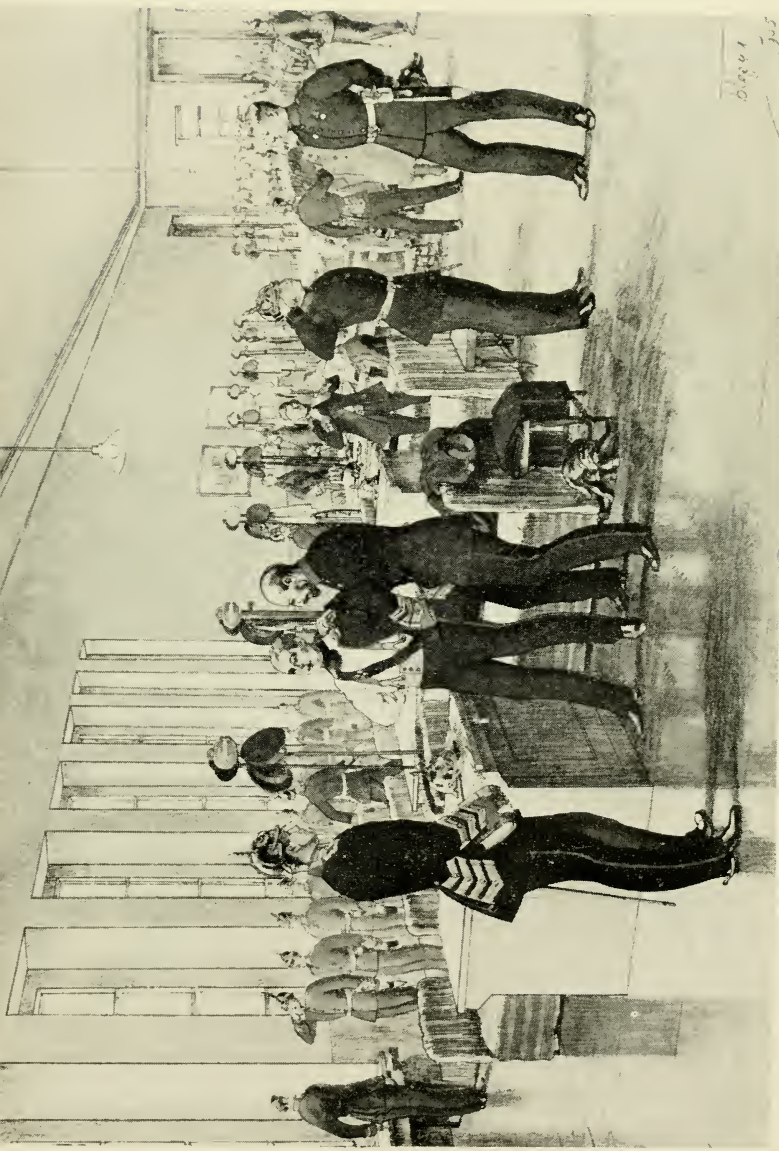
Шажский Его Императорского Величества корпус Отпускной день