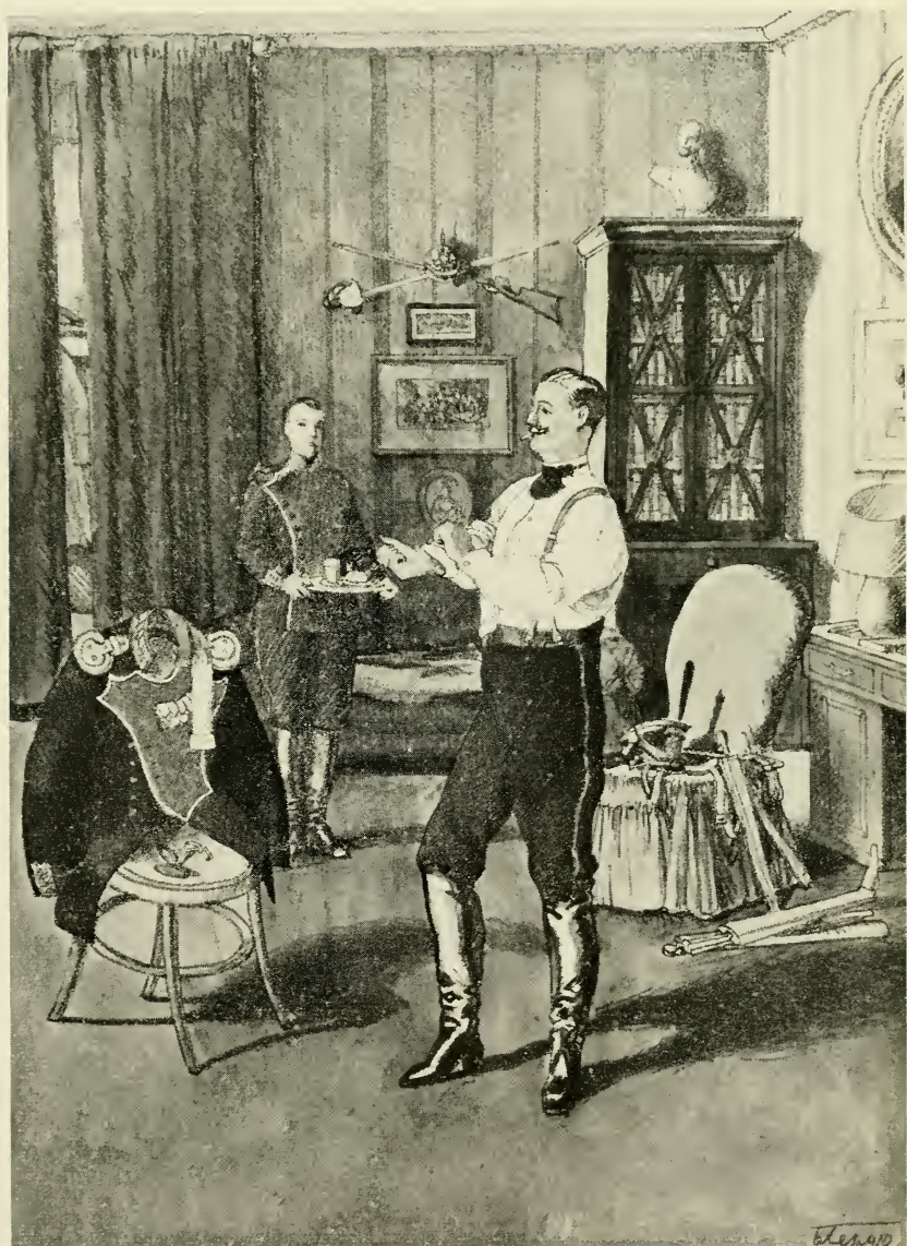
Парадное утро гвардейского офицера